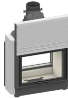
Lina TV 73 mit hochschiebbarer Frontseite und schwenkbarer Rückseite